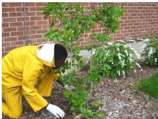
Le projet de lutte contre les îlots de chaleur aux HLM Ilots Saint Martin visait à transformer des espaces gazonnés en plate-bande (1400 pieds carrés) et planter des vignes vierges pour verdir les murs.

Excavation de ruelles, aménagement de parterres, verdissement de cours d'écoles, animation d'ateliers horticoles, une diversité d'organisations et d'institutions ont bénéficié de leur savoir-faire : l'école Saint Jean de Brébeuf , le CPE Cœur de l'Île et une dizaine de ruelles vertes à Rosemont – La Petite - Patrie. Le Centre d'écologie urbaine , la Commission Scolaire de la Pointe de l'Île ou encore des particuliers, ont fait appel également aux services des Pousses Urbaines.