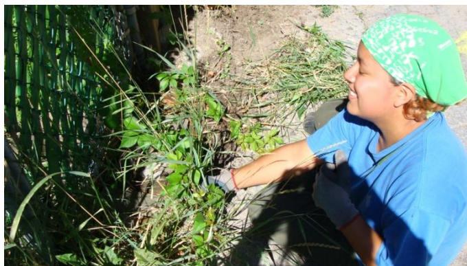
Plus de 500 végétaux (vivaces, semis, annuelles, arbres, arbustes, etc.) ont été plantés en 2012 par les Pousses Urbaines, notamment dans les ruelles vertes.